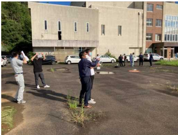
実機操作訓練状況（屋外）