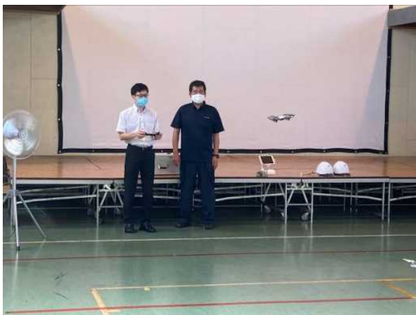
実機操作訓練状況（室内）

初心者班は、まずはドローンの操作感覚に慣れるため、専用施設の屋内で小型機（DJI 製 Tello）の操作を体験した。屋内も気温が高く、一人操作するごとに機体を扇風機で冷やさないとオーバーヒートするような状態であったが、マンツーマンの操作指導に参加者も満足していた様子であった。