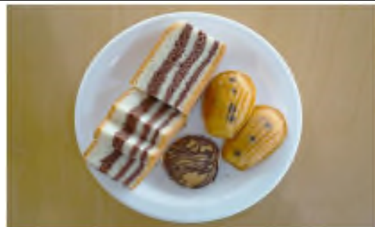
山房山近くの「ウェンドゥグニ」が提供するジオフード 龍頭海岸の地層カステラ、ハモリ層火山弾クッキー、西帰浦層 貝の化石型マドレーヌ

ジオパークの地質的特性や文化をモチーフにして、地元食材を活用して作ったローカルフード。濟州島の様々な観光地に、ジオフードを提供するカフェやレストランがある。