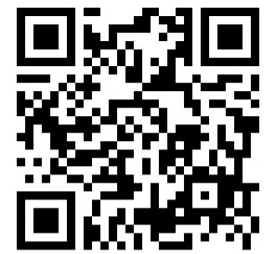
○ 申込専用フォーム