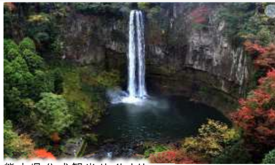
熊本県公式観光サイトより

https://kumamoto.guide/spots/detail/11819