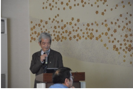
塚脇先生による特別講演