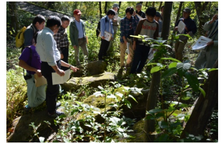
戸室石石切丁場跡