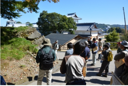
現地見学会 金沢城石垣