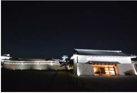
意見交換会会場 河北門