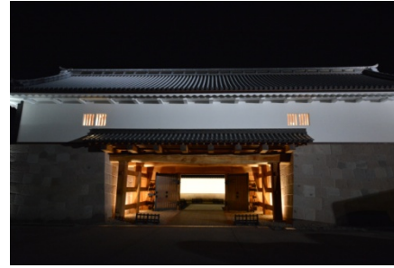
意見交換会会場河北門2階