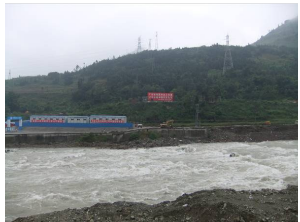
映秀の岷江右岸に見られた地表地震断層を伴う撓曲崖

震央直近の映秀には地表地震断層が出現し、市街地が大きな被害を受けた。一方、震央から約 12 km に位置する紫坪壩ダム(コンクリート遮水壁型ロックフィルダム)では、湖岸斜面に崩壊が多数発生していたが、堤体には大きな損傷は見られなかった。都江堰は、紀元前 3 世紀に建設された現役の大規模水利施設で、世界遺産に認定されている。本体の損傷は軽微であり観光も復活していたが、周辺の山地に分布する寺院などは大きな被害を受け、まだ復旧に至っていない。