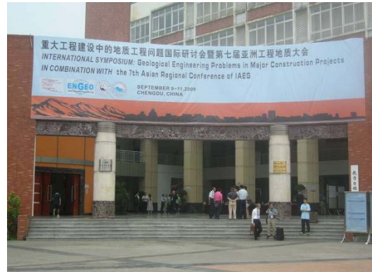
成都工科大学の会議場

会議では、12人の招待講演と63人から口頭発表があり、131件の論文と82件のアブストラクトが予稿集に収められたが、2分冊1020ページもあるためCDのみとして持ち帰りを断念した参加者もあった。