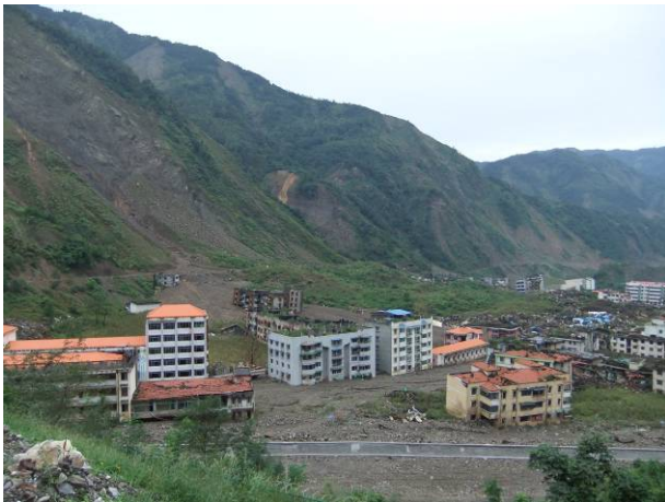
地震で倒壊し崩壊と土石流で埋まった北川市街地の建物

綿陽市から安昌鎮を経て、公安の警護付きで北川の市街地にはいった。町は北川羌族自治県の中心地であるが、住民3万人のうち1万5千人以上が亡くなった。現在は無人となった市街地には倒壊した建物が多数の行方不明者とともにもそのまま残されており、地震後の9月に発生した土石流で埋まった建物も多い。