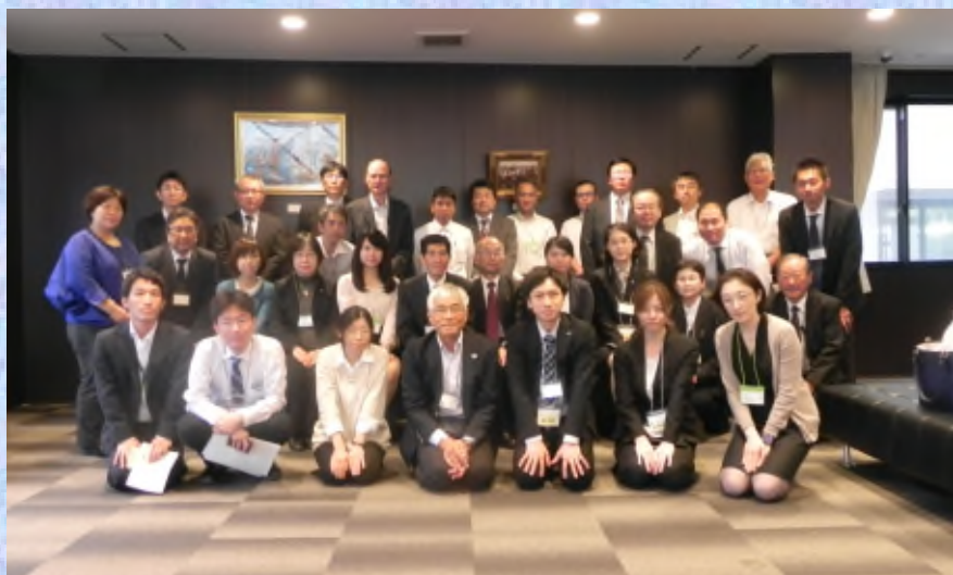
アース・サロンvol.2(参加者記念写真)