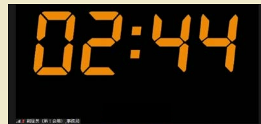
時間経過表示イメージ