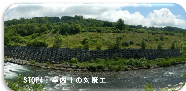
STOP4：幸内 1 の対策工