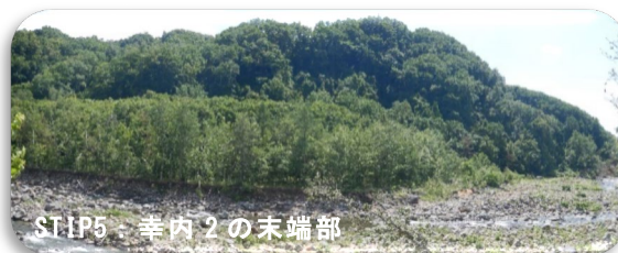
STOP5：幸内 2 の末端部