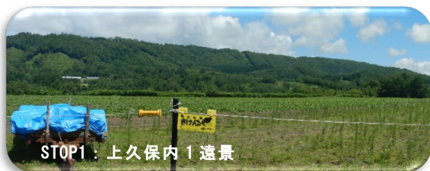
STOP1：上久保内 1 遠景