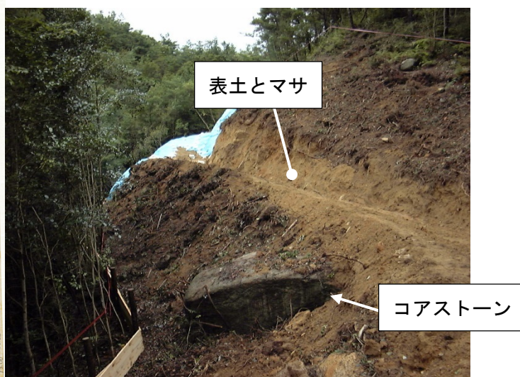
写真-5 掘削時に出現したコアストーン