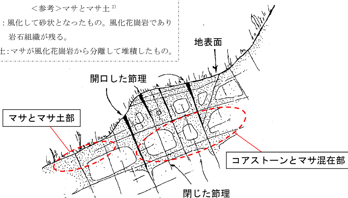
図-1 花崗岩の節理に伴う風化形態模式図 (1)より引用・加筆)