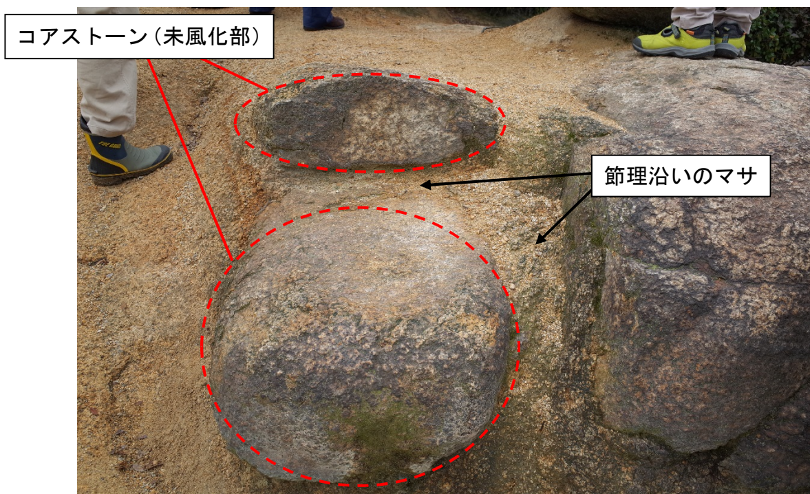
写真-1 風化花崗岩中に発達したコアストーン（岡山県玉野市）