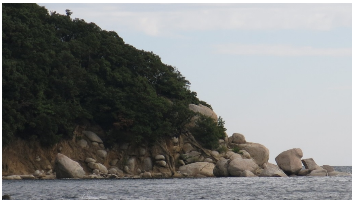
写真-2 花崗岩の風化の様子（香川県小豆島町）