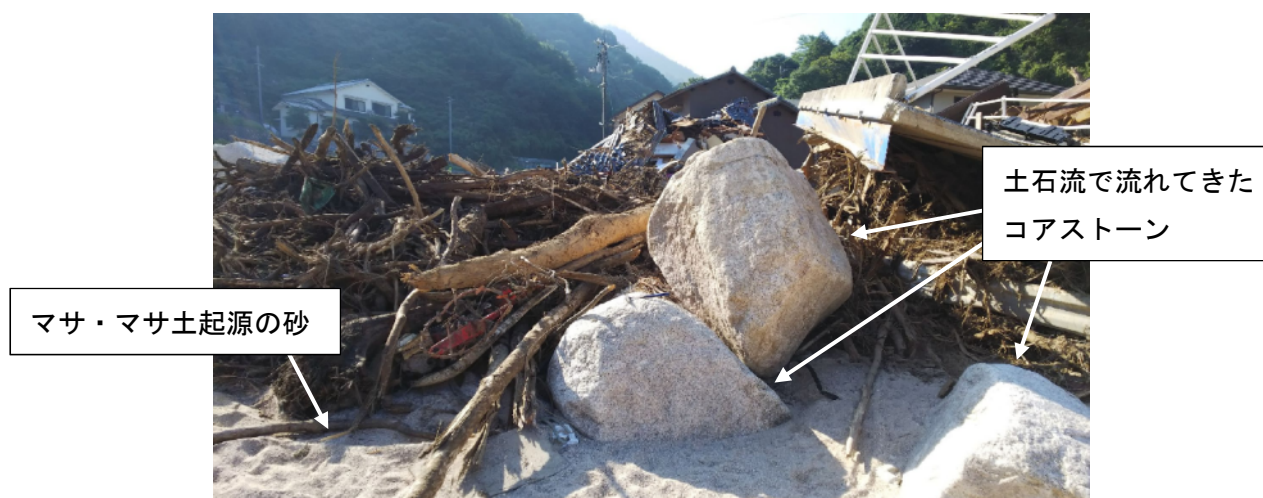
写真-3 土石流で流れてきたコアストーン（広島県）

花崗岩地域では土砂や流木とともにコアストーンも土石流として流されます。コアストーンは比較的新鮮でハンマーでも割れない硬さのものが多く、また、大きさは様々で大きいものは2mを超えるものもあるため、土石流の威力が大きくなります。平成30年7月豪雨でもコアストーンによって土石流の威力が大きくなっていることが確認されました（写真-3）。