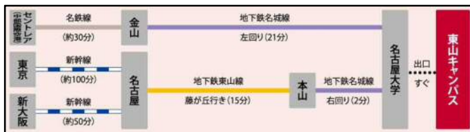
名古屋大学への交通アクセス